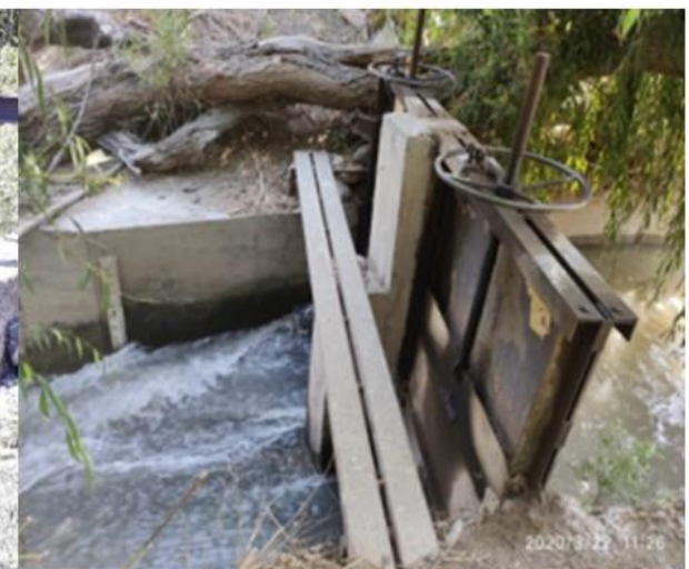
Foto 1. Canal La Pirca.